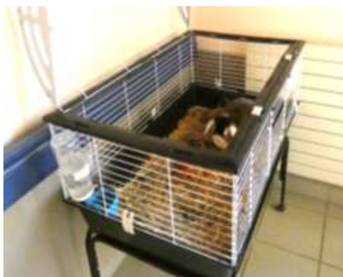
Bounty dans sa nouvelle cage !